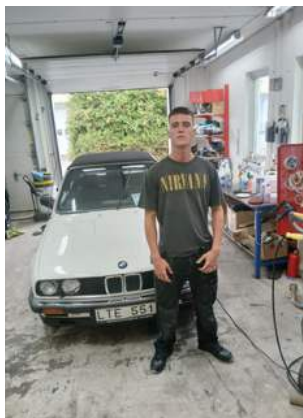
En av deltagarna från Italien gör praktik på Classic Cars i Ystad.

Årets besök från italienska Tempo Libero har planerats sedan i januari då en mindre delegation italienare kom för att reka innan man bestämde sig för att Sverige, Furuboda och Malmö var rätt organisation och plats för att ta emot deras grupp. Vi lyfte ett litet varningens finger gällande tidpunkten till våra italienska kollegor som ville förlägga starten de första dagarna i augusti. Vårt land har ju liksom en tendens att stanna av under sommarlov och semestrar.