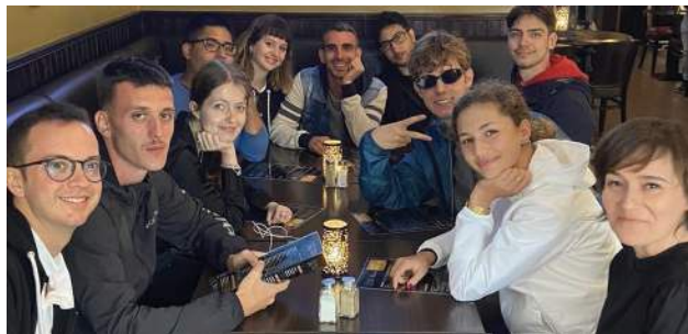
Den italienska gruppen praktiserar främst på second-hand-butiker runt om i Skåne.

Vandrarhem och boenden bokas upp av semestersugna turister och arbetsplatser är till bredden fyllda av sommarjobbade ungdomar.